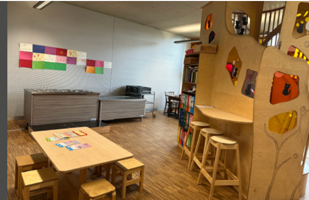
Restaurant du préscolaire

Dans un SEAS ouvert, les éducateurs accompagnent les enfants de manière bienveillante et individualisée. Au cœur de leur mission se trouve une relation de confiance qui favorise l'autonomie et l'épanouissement personnel. Grâce à l'observation et à la réflexion, ils proposent des impulsions ciblées pour soutenir le développement. Les espaces et les activités sont adaptés aux besoins des enfants et encouragent le jeu créatif. La collaboration avec les parents et au sein de l'équipe est transparente et coopérative. La participation et la transmission de valeurs sont des éléments centraux : les enfants vivent les principes démocratiques au quotidien. L'approche pédagogique est marquée par l'ouverture, la réflexion et un accompagnement respectueux.