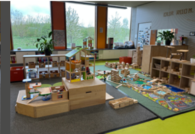
Salle de construction

Nous sommes un SEAS (service d'éducation et d'accueil pour enfants scolarisés) international avec une équipe tout aussi interculturelle composée de 34 collaborateurs engagés. Ensemble, nous accueillons environ 350 enfants âgés de 4 à 12 ans. Notre structure fait partie de la Croix-Rouge luxembourgeoise depuis octobre 2024 et est étroitement liée au Lycée International de Lénster. Nous partageons non seulement le bâtiment (un nouveau bâtiment est déjà en projet), mais aussi une collaboration étroite entre enseignants et éducateurs. En tant que Maison Relais internationale, nous proposons un encadrement multilingue avec une pédagogie interculturelle qui intègre activement la diversité culturelle dans le quotidien. Notre concept pédagogique repose sur l'ouverture, la participation et le soutien individuel. Dans une atmosphère bienveillante, nous offrons aux enfants un espace pour s'épanouir, jouer, apprendre et participer activement à leur quotidien.