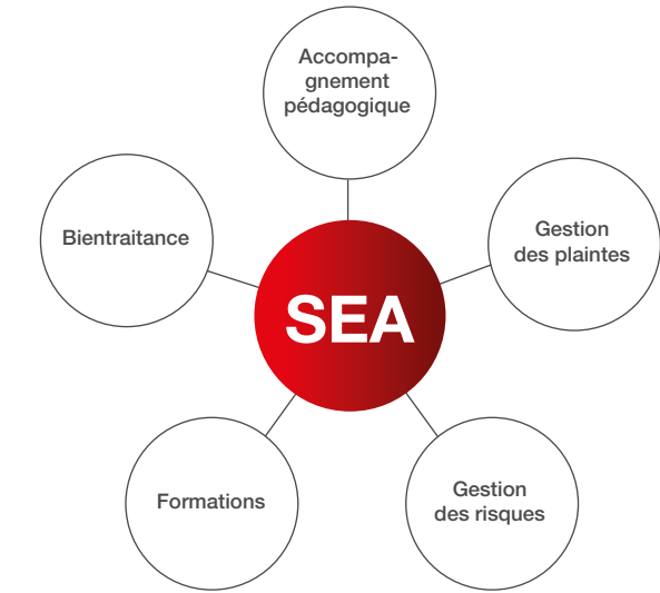
La qualité au cœur de notre démarche

Notre objectif vis-à-vis des parents et des communes est de garantir et d’améliorer constamment la qualité de l’encadrement de tous les enfants qui nous sont confiés. Pour atteindre cet objectif, nos Services d’éducation et d’accueil (SEA) se sont dotés d’une coordination active dans différents champs d’action.