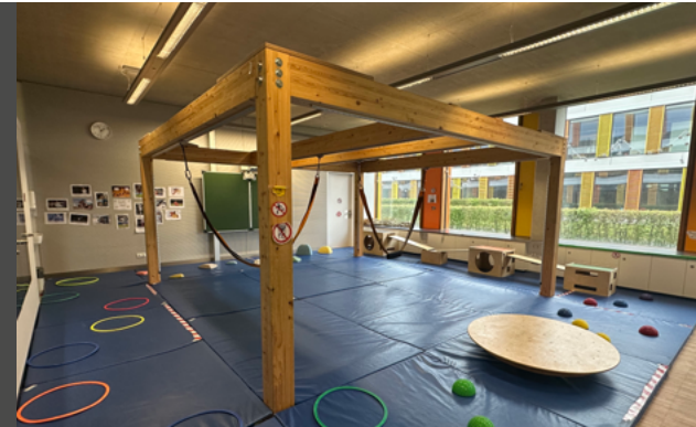
Salle de mouvement

Les deux groupes profitent quotidiennement de notre vaste espace extérieur pour bouger, jouer et découvrir la nature.