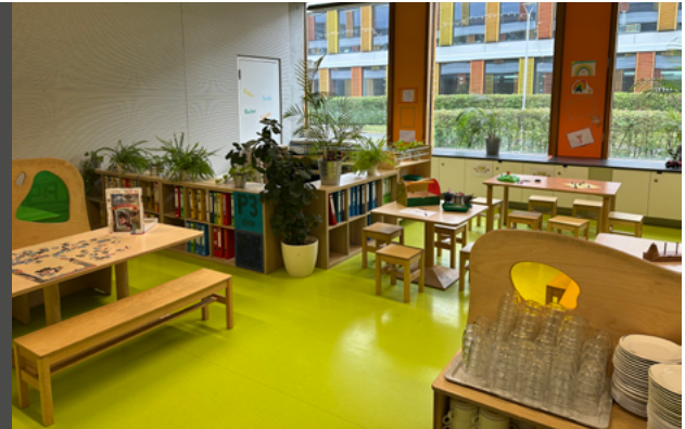
Restaurant du primaire

Dans notre Maison Relais ouverte, il est essentiel pour nous que les enfants puissent s'exprimer et participer activement. Ils contribuent à l'organisation de leur journée – que ce soit lors des repas, des jeux, des projets ou du choix des activités. Nous prenons leurs idées au sérieux et les impliquons dans les décisions, par exemple dans l'aménagement des espaces, l'élaboration des règles ou les actions communes. Ainsi, les enfants apprennent à prendre des responsabilités, à exprimer leur opinion et à se sentir partie intégrante de la communauté. La participation renforce la confiance en soi et favorise une cohabitation respectueuse.