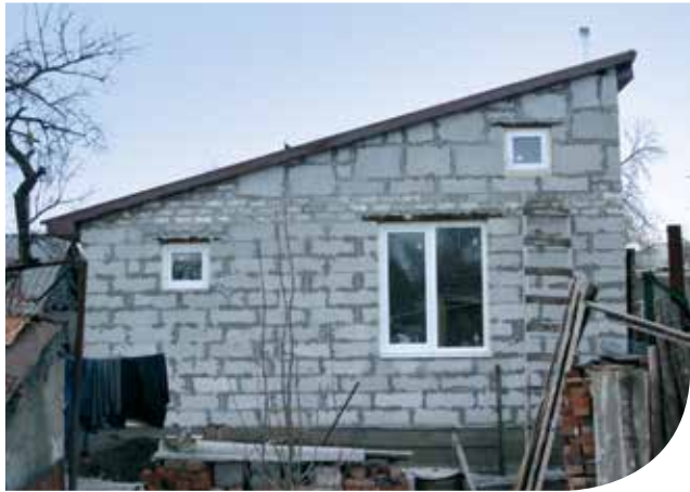
Maison reconstruite à Slavyansk.

Depuis 2014, les conflits politiques ont causé la mort d'environ 6000 personnes et le déplacement de 1,4 millions de personnes. Les régions se situant le long de la ligne de front ont subi des destructions dévastatrices qui ont touché des maisons familiales, des bâtiments publics et des infrastructures comme des