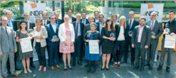
La remise officielle du label a eu lieu le 9 juin à la Chambre de Commerce.

Ne manquez pas la Fête du Château annuelle à Colpach, une grande fête familiale en faveur de la Croix-Rouge, organisée par la section locale Schlassfest. Les activités débuteront dès samedi après-midi avec une vente de vélos d'occasion. Un repas sera proposé en soirée, suivi du concert du chœur d'hommes de Boevange-Attert. Dimanche, les festivités débuteront dès 10 heures. Une grande variété d'activités vous seront proposées : bazar, marché aux puces, tombola, foire aux livres, concert, démonstration de l'Unité cynotechnique de la Croix-Rouge, jeux pour enfants, etc. En guise de restauration, des grillades ou des menus vous seront proposées ainsi que des desserts. Venez profiter de cette journée en famille dans un beau cadre ! Plus d'informations au 2755-4300.