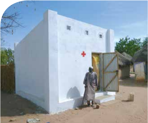
Maison en banco au Sénégal.

La période des pluies cause régulièrement des inondations. Un grand nombre de cases en banco ne résistent pas aux fortes précipitations et les habitants s'y retrouvent sans toit. La Croix-Rouge luxembourgeoise travaille dans les communes de Thiaré et de Ronkh pour construire des cases plus résistantes aux pluies. Jusqu'en fin d'année elle prévoit d'offrir une maison à