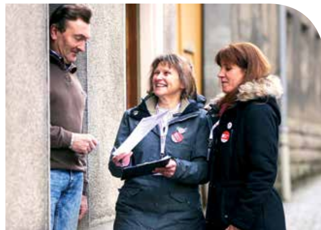
Plus de 2 000 bénévoles collectent des dons pendant le Mois du Don en avril.

Ce n'est qu'en s'appuyant sur l'élan de solidarité de la population, qu'il soit humain ou financier, que la Croix-Rouge pourra agir contre la misère aussi bien au Luxembourg qu'à l'étranger. ■