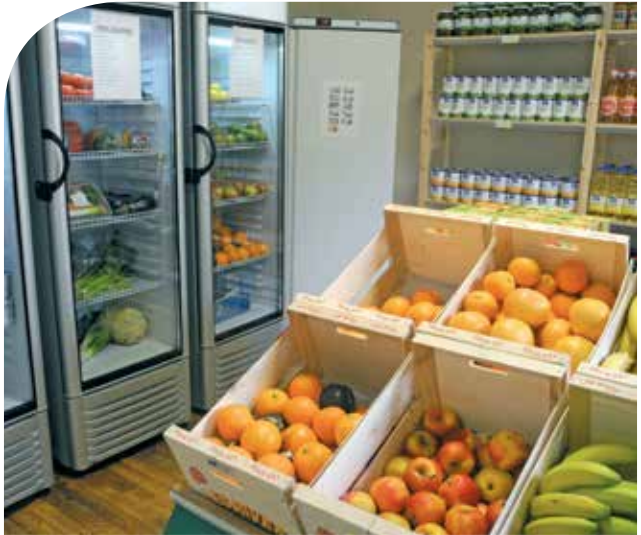
Épicerie sociale de Steinfort.

L'activité « Vestiaires » de Luxembourg-Ville a augmenté ses horaires d'accueil aux bénéficiaires, passant d'une demi-journée à trois demi-journées