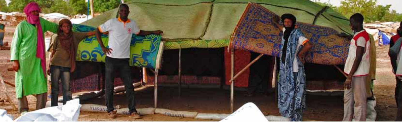
Abri traditionnel adapté au mode de vie nomade de réfugiés maliens.