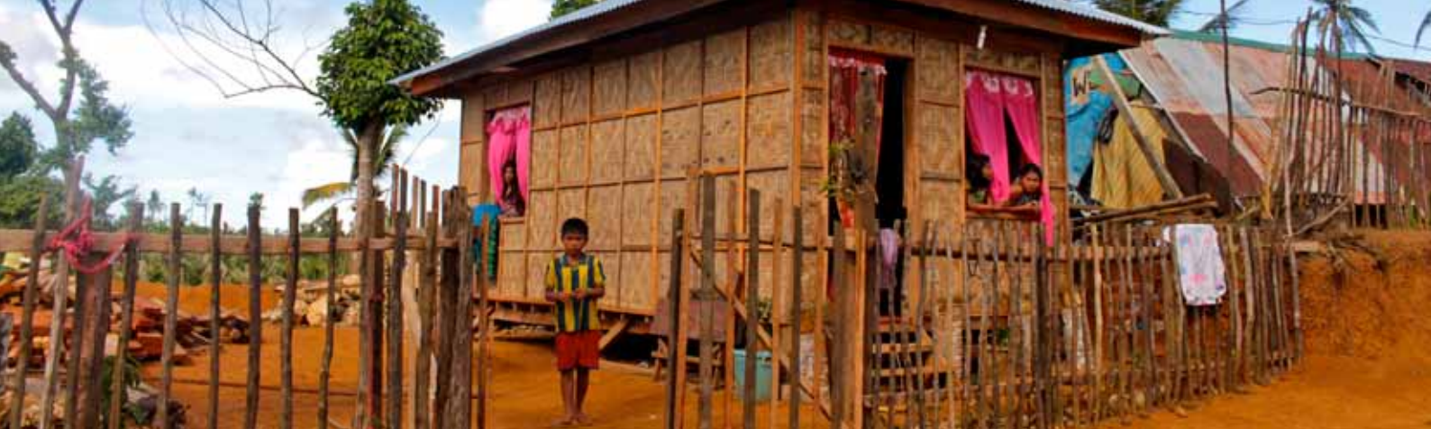
Type de maison reconstruite à la suite du passage du typhon Haiyan aux Philippines.