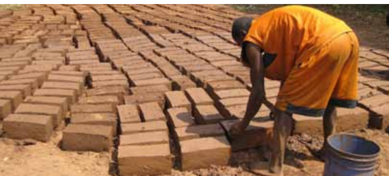
Fabrication de briques d'adobe au Burundi.

La Croix-Rouge luxembourgeoise soutient les Sociétés nationales sœurs dans le pays concerné en mettant à disposition les matériaux et l'expertise nécessaires. Pourtant, le but principal de cette phase n'est pas seulement de reconstruire les mêmes maisons qu'auparavant mais de mieux reconstruire. En transmettant aux membres de la communauté les compétences nécessaires pour construire des maisons plus stables, on veille à ce que les connaissances des techniques de construction plus sûres restent au sein de la communauté, même une fois les acteurs humanitaires partis.