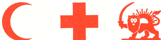
Fig. 2: Signes distinctifs en rouge sur fond blanc