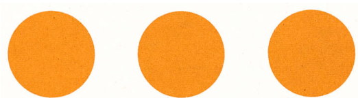
Fig. 5: Signe spécial international pour les ouvrages et installations contenant des forces dangereuses